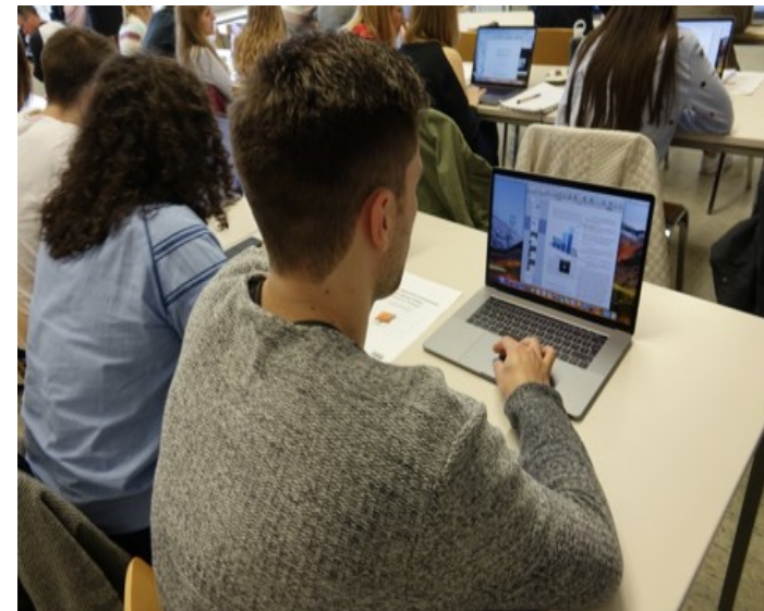
Studierende an der JGU erproben und entwickeln den Einsatz digitaler Medien im Englischunterricht.

Für Studieninteressierte gibt es auch Schnuppertage: https://www.studium.uni-mainz.de/studienwahl/studienorientierung/schnuppertage/